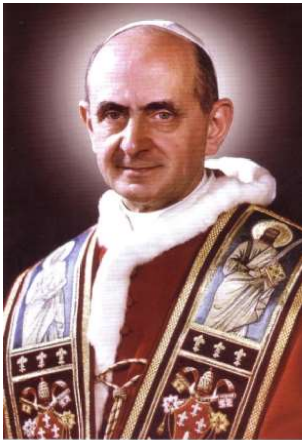
PAOLO VI (1897-1978)

- Hoặc can đảm chấp nhận đau khổ để cho ra chào đời những đứa con cùng giống nòi, hoặc mong muốn một ít dễ dãi nhưng được chấp nhận, cảm thông.